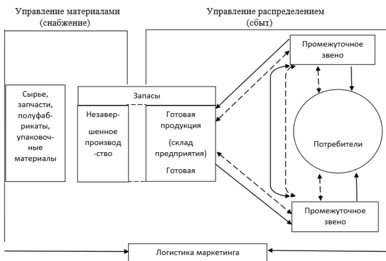
рисунок 1 – пример оформления рисунка

Иллюстрации должны иметь наименование и, если необходимо, пояснительные данные (подрисуночный текст). Слово «Рисунок», его номер и через тире наименование помещают после пояснительных данных и располагают в центре под рисунком без точки в конце (рис.1).