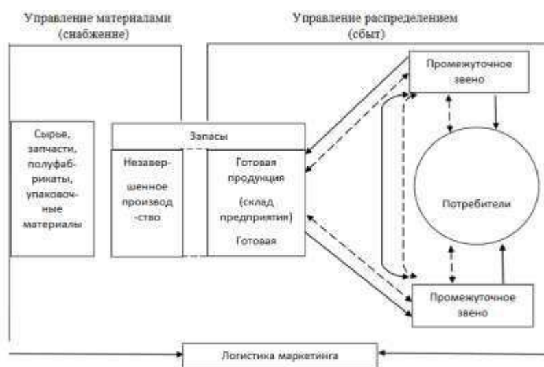
Рисунок 1 – Принципы логистической системы

Иллюстрации должны иметь наименование и, если необходимо, пояснительные данные (подрисуночный текст). Слово «Рисунок», его номер и через тире наименование помещают после пояснительных данных и располагают в центре под рисунком без точки в конце (рис.1).