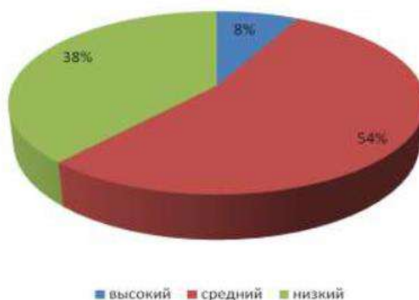
Рисунок 3 – Уровни сформированности лексических умений младших школьников по методике «Что такое? Что значит слово...?», автор Ф.Г. Даскалова Рисунок 1 – Пример оформления рисунка

Иллюстрации каждого приложения обозначают отдельной нумерацией арабскими цифрами с добавлением перед цифрой обозначение приложения. Например, Рисунок А.3