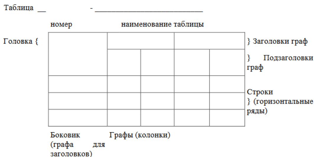
Рисунок 2 – Макет таблицы

После таблицы должно быть оставлено не менее одной свободной строки.